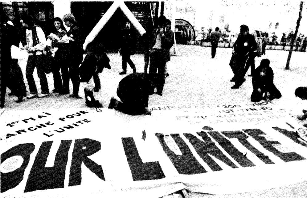
1er mai 1980: La LCR à genoux devant l'«unité»

Ce n'est pas en tous cas la position de Krivine et Mandel sur l'URSS et les autres pays où la bourgeoisie a été expropriée qui risque de faire peur. Depuis que l'impérialisme s'est de nouveau lancé dans une campagne de guerre froide contre l'URSS, la LCR fait tout pour éviter cette question. Mais à ses meetings de Bordeaux et Montpellier, Krivine n'a pas pu se défilier et il a été obligé de nous répondre. "L'URSS n'est pas menacée" prétend-il. Apparemment Krivine est un des rares spécimens à ignorer qu'il y a à la Maison Blanche un individu qui a déclaré la guerre au soi-disant "expansionnisme russe". Apparemment il