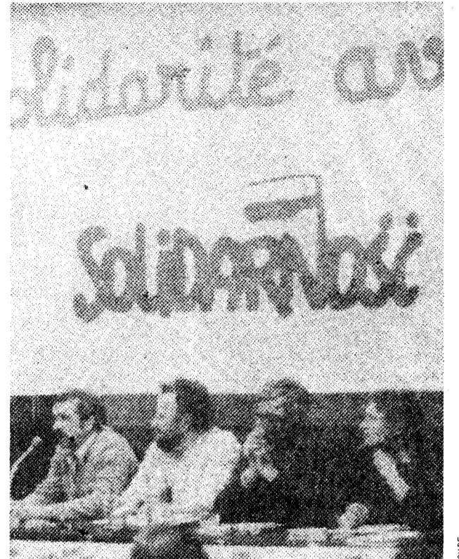
16 mars: meeting du Comité Solidarité à Rouen

Ce dont a besoin la classe ouvrière et d'ailleurs ce que recherchent les travailleurs les plus conscients, ce n'est pas l'unité du PC et du PS (dont beaucoup ont compris au travers de leur expérience le caractère traître des directions), mais un programme et un parti défendant les intérêts de classe du prolétariat contre la bourgeoisie. C'est le sens de notre combat ■